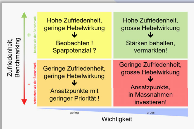
Portefeuille avec pondération de toutes les questions