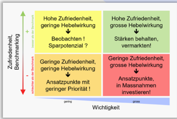
Portfeuille avec pondération des réponses